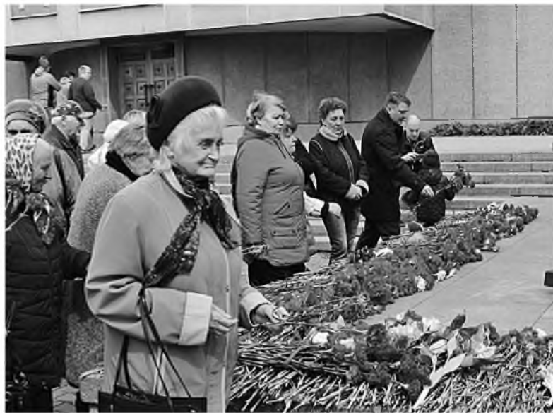
Активное участие в праздничных мероприятиях приняли ветераны холдинга

Работники компании «Сибирский цемент» стали участниками мероприятий, приуроченных ко Дню Победы. Накануне 9 Мая поздравления принимали ветераны производств – фронтовики, труженики тыла и те, чье детство прошло в тяжелые 40-е.