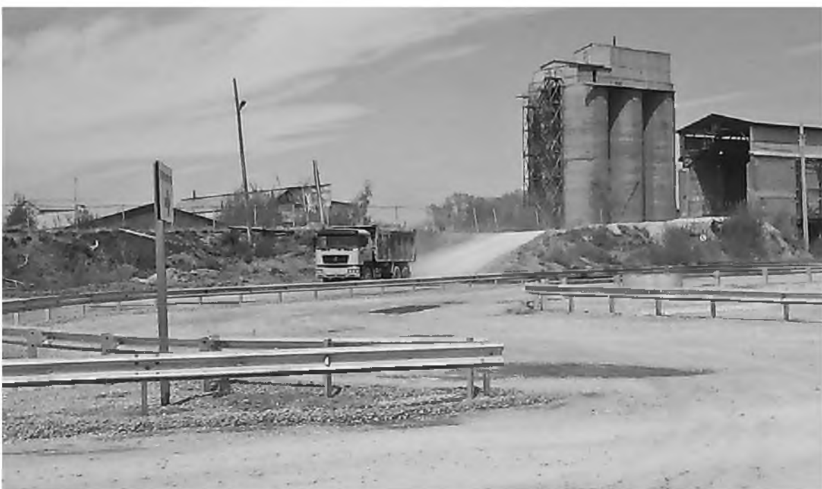
Дороги на участке отгрузки отсыпаны щебнем

На Тимлюйском цементном заводе продолжается благоустройство участка отгрузки цемента.