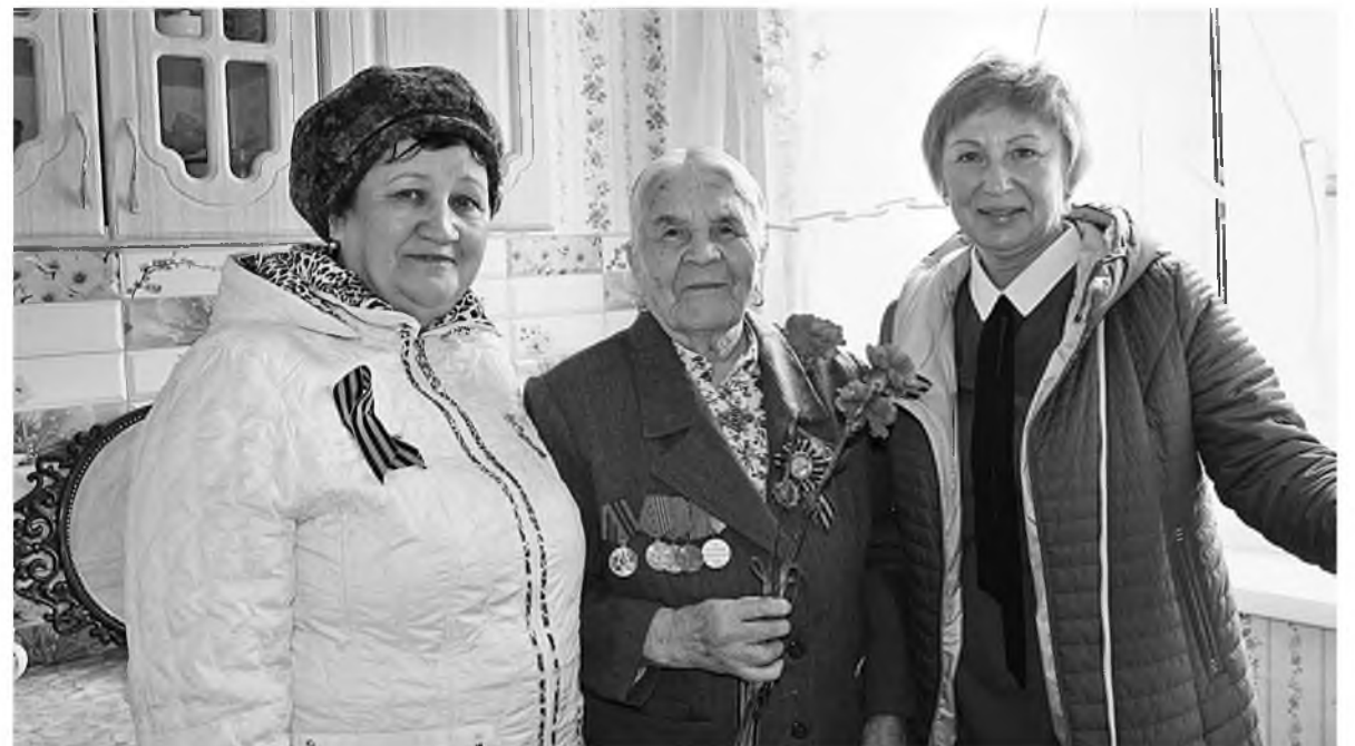
Накануне 9 Мая ветераны Топкинского цемзавода принимали поздравления