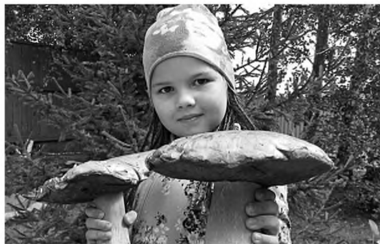
Любимое семейное увлечение – ходить за грибами