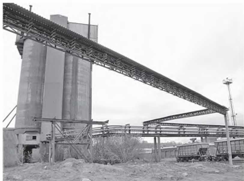
Затраты на возведение новых линий электропередачи окупятся к маю 2019 года

«Красноярский цемент» завершил строительство кабельной трассы, соединяющей промышленную площадку с подстанцией «Правобережная».