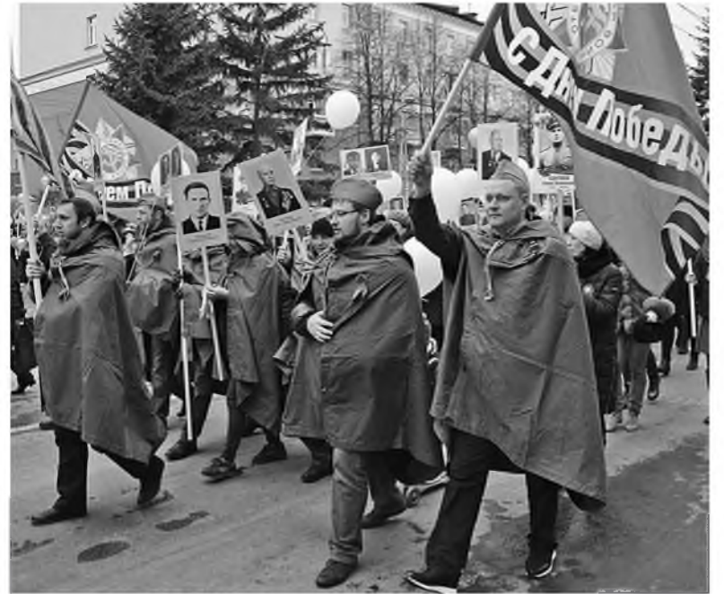
Кемеровчане прошли в праздничной колонне по центральным улицам города