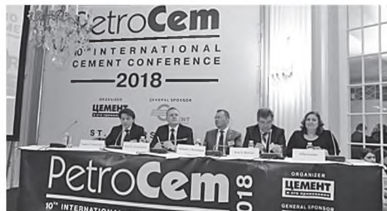
PetroCem-2018 объединил более 520 человек из 34 государств