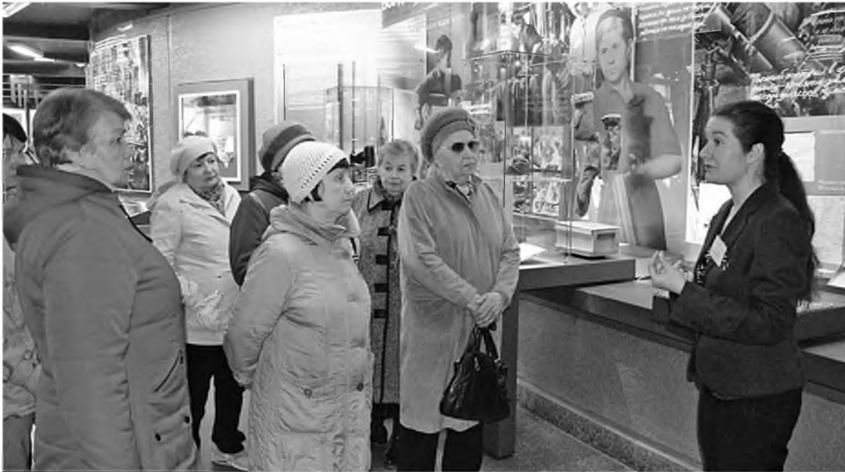
Ветераны красноярских предприятий холдинга посетили музей «Мемориал Победы»