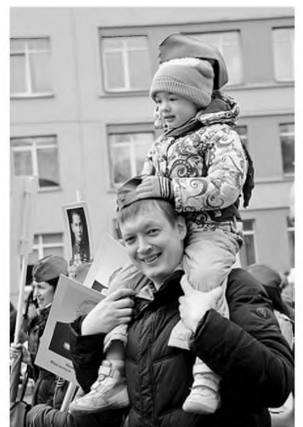
Вместе с родителями на праздник пришли и совсем юные сибцемовцы