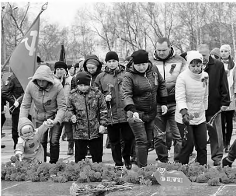
Топкинские цементники возложили цветы к памятнику воинам-топкинцам, погибшим в годы Великой Отечественной войны