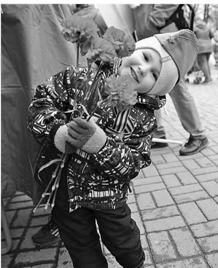
Малыши радовались Дню Победы так же, как и взрослые