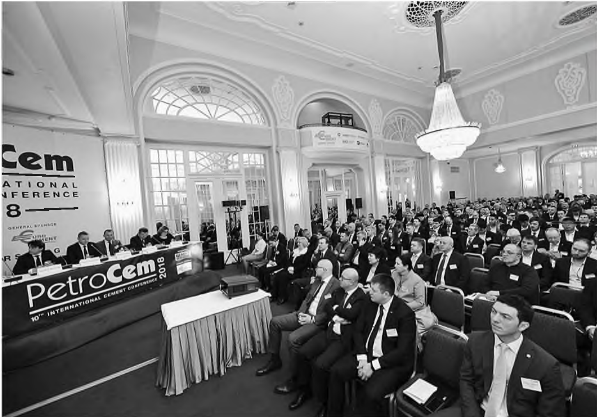
В этом году конференция PetroCem проводилась уже в 10-й раз

Представители «Сибирского цемента» приняли участие в 10-й международной конференции PetroCem-2018, проходившей с 22 по 24 апреля в Санкт-Петербурге.