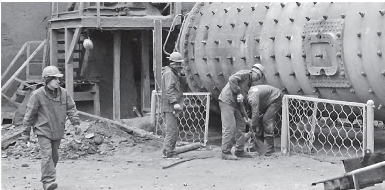
Текущий ремонт цементной мельницы № 8 проводился в течение двух недель

На Красноярском цементном заводе продолжается подготовка оборудования к «высокому» строительному сезону. После планового ремонта в цехе «Помол» в эксплуатацию пущена мельница № 8.