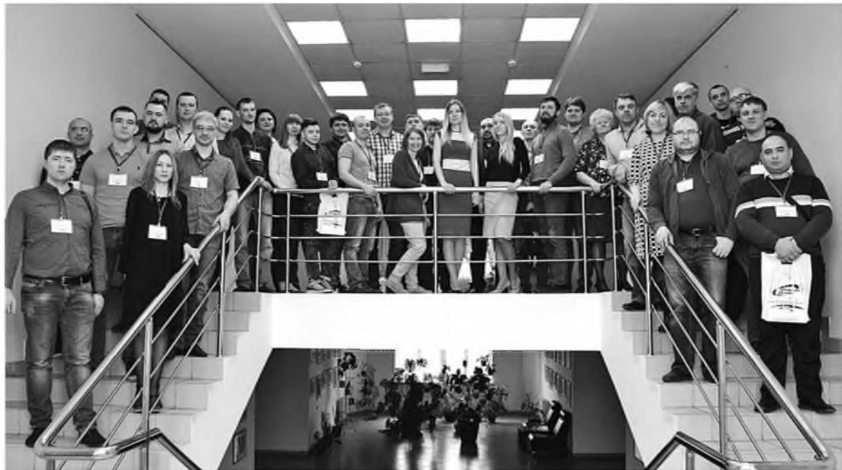
Слет объединил IT-специалистов из разных регионов

В конце апреля в городе Кемерово состоялся VI слет IT-специалистов «Сибирского цемента». В первый день мероприятия, объединившего более 40 человек, сотрудники департамента информационных технологий, представители других служб и департаментов, топ-менеджеры холдинга и эксперты Microsoft, SoftLine, AXXTel выступили с докладами, во второй был организован интерактивный квест.