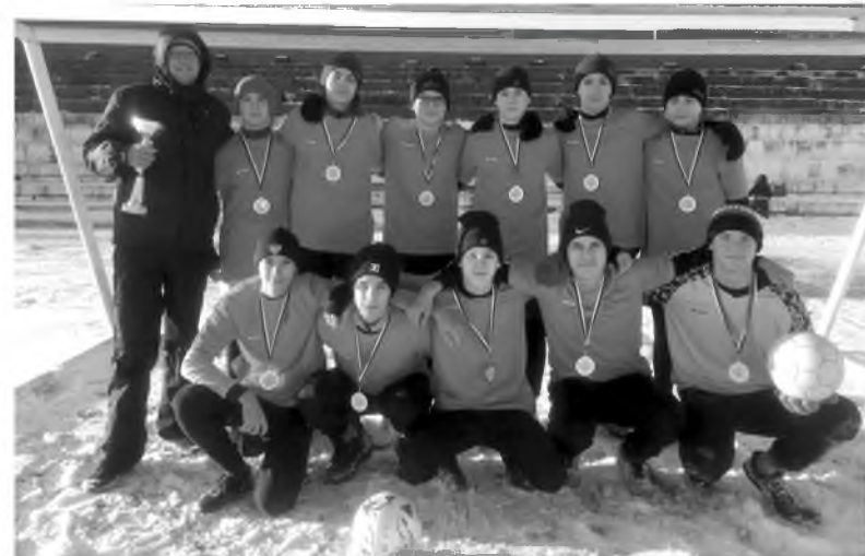
Футбольная команда «Сибцем»

Завершил сезон-2020 открытый турнир по мини-футболу, приуроченный ко Дню народного единства, добавив в копилку топкинских спортсменов бронзу.