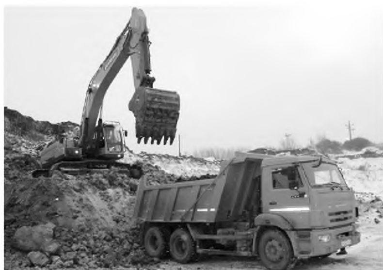
Новый экскаватор уже в работе