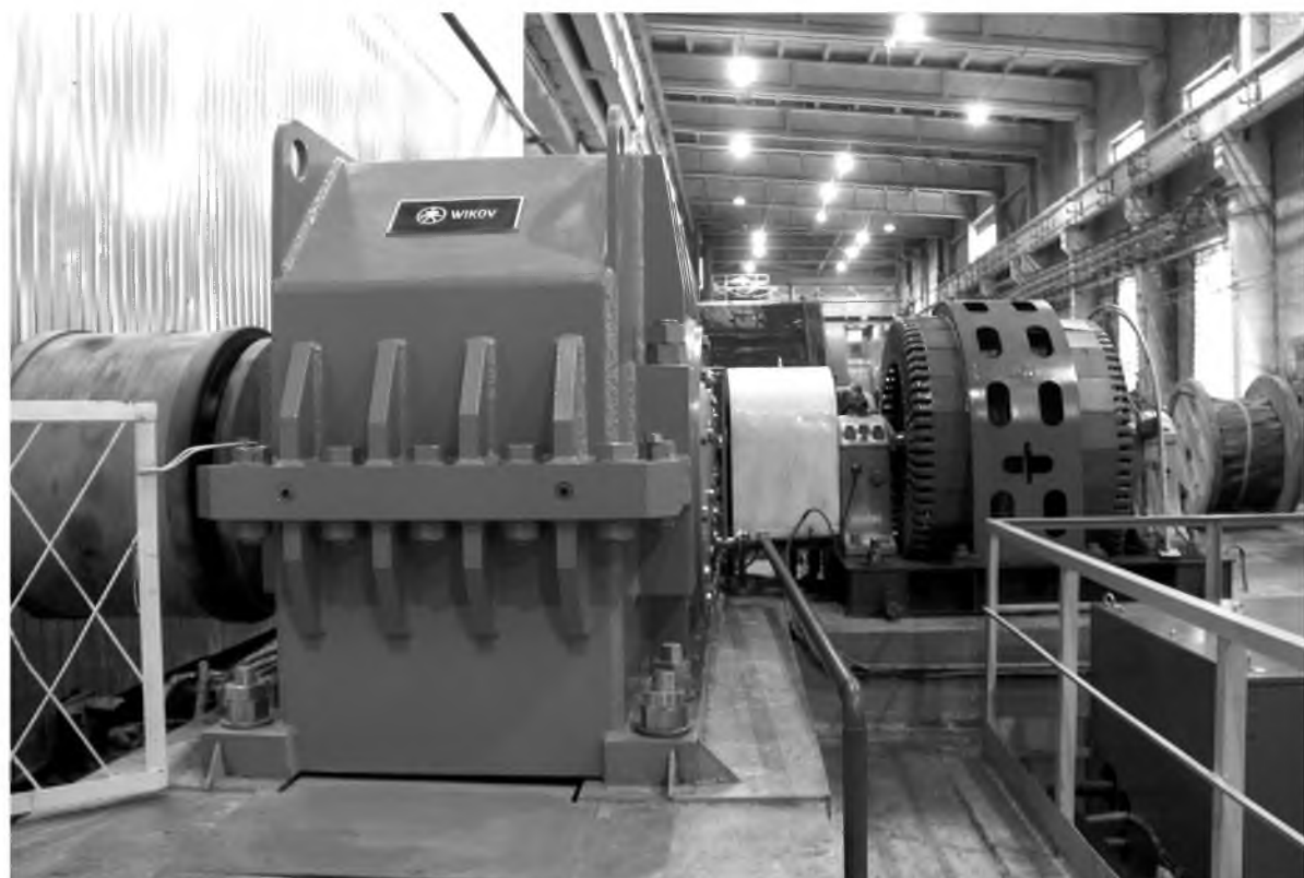
В 2020 году в цехе «Помол» установлен современный редуктор