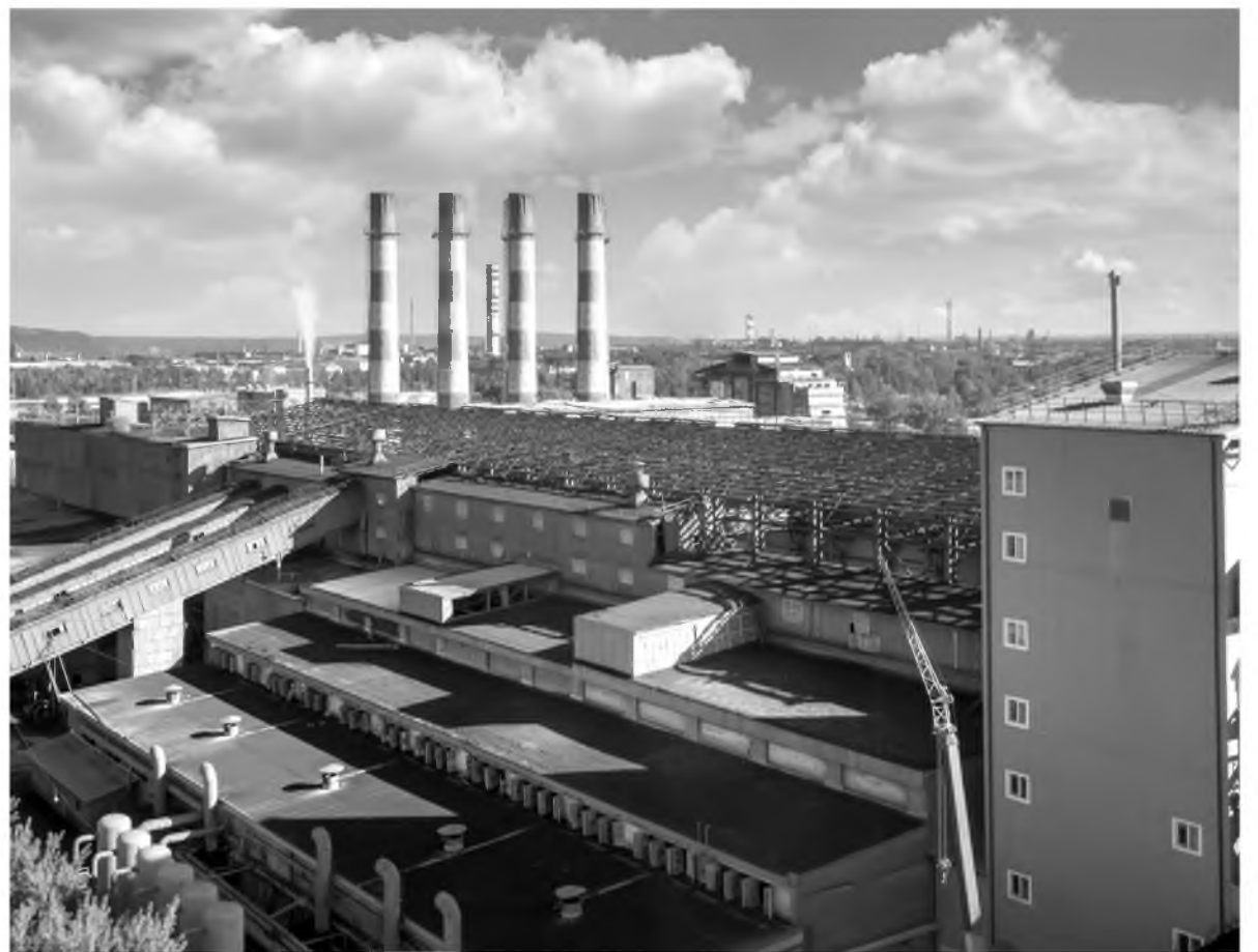
Предприятие награждено за значительный вклад в развитие региона

АО «Ангарскцемент» вносит вклад в улучшение экологии региона. В 2019 году на комбинате завершились три крупных инвестиционных проекта по снижению воздействия на окружающую среду. Общая сумма затрат на их реализацию составила 394 млн рублей (с НДС). В 2020-м, несмотря на