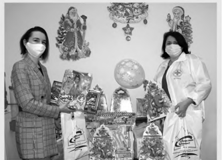
Сибцементовцы передали детям сладости и игрушки

По доброй традиции работники управляющей компании и кемеровских предприятий холдинга «Сибирский цемент» присоединились к ежегодной акции «Рождество для всех», организованной Кемеровским региональным отделением Российского Красного Креста.