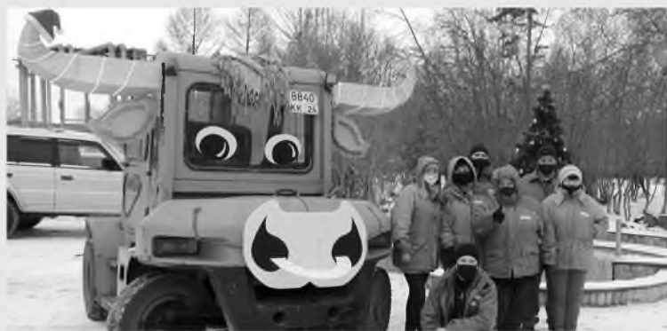
Фотографироваться с символом года – к удаче, считают на «Волне»

ООО «Комбинат «Волна» вошло в число призеров зимнего этапа конкурса «Самый благоустроенный район города Красноярска» в 2020 году. Предприятие заняло почетное третье место в номинации «Самая благоустроенная территория предприятия и офиса» в Свердловском районе.