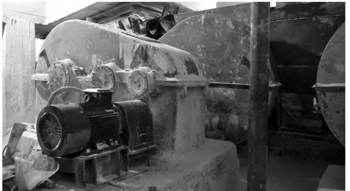
Ремонтники заменили все изношенные детали питателя

Помимо этого, была восстановлена зубчатая муфта соединения электродвигателя и провала, заменены корпуса подшипников, вкладыши провала и вал-звездочки пластинчатого питателя, проведена ревизия верхних и нижних роликов. Бронзовые втулки, по рекомендации поставщика запчастей, решено заменить опытной партией из полимеров. В процессе эксплуатации питателя специалисты завода будут контролировать состояние вкладышей и втулок из полимеров на предмет их износостойкости и экономической целесообразности применения в будущем на других по-