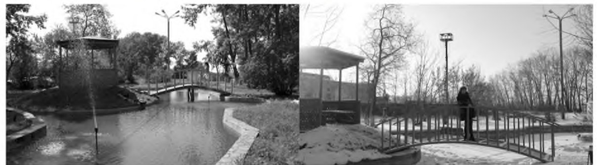
На «Байкале» хорошо и зимой, и летом