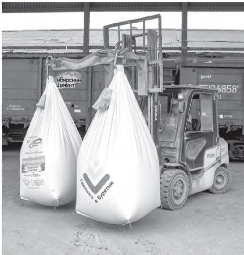
Завод готов отгружать сертифицированную продукцию по запросам потребителей

При производстве сульфатостойкого клинкера необходимо строго выдерживать минералогический состав, содержание трехвалентного алюмината не должно превышать 3,5%. Для достижения этого показателя в сырьевой шлам не добавляли одну из часто используемых при производстве других видов цемента добавку – золуноса. В результате снижения содержания оксида алюминия химический состав сырьевой смеси полностью изменился. Отобранные пробы из партии цемента, произведенного в ноябре 2020 года, были направлены в аккредитованную лабораторию «Сибирского научно-исследовательского института цементной промышленности» (г. Красноярск). Максимальный показатель содержания щелочных оксидов по ГОСТу не должен превышать 0,6%, результат, указанный в протоколе испытаний надзорного органа, показал лучшее значение в 0,46%.