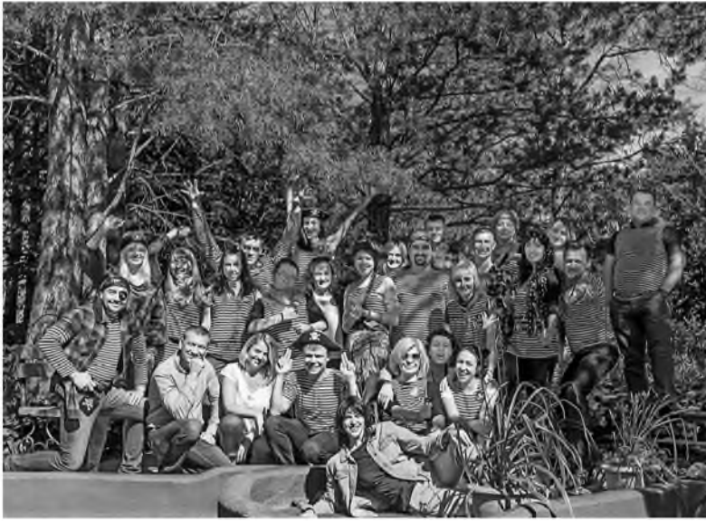
Профессиональный праздник - День железнодорожника - специалисты КТЦ встретили своей дружной командой

5 августа в нашей стране отметили День железнодорожника. По традиции накануне профессионального праздника в компании «КузбассТрансЦемент» (далее – КТЦ) рассказали о достигнутых результатах и проблемах, которые еще предстоит решить.