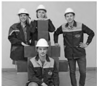
Кемеровчане приняли участие в необычном квесте

В честь Дня строителя «Сибирский цемент» организовал торжественные мероприятия для работников и ветеранов. Различными наградами отмечены более 300 человек.