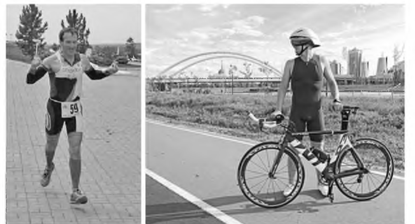
Спортсмены «Сибцема» продолжают радовать своих болельщиков

Высокий уровень конкуренции легко объяснить: на турнир приехали более 10 тысяч человек. Они не только соревновались, но и осматривали достопримечательности острова Фюн, принимавшего фестиваль. «Его нередко называют «велосипедным» островом, и это логично: соответствующая инфраструктура там развита настолько, что велосипедисты чувствуют себя увереннее пешеходов. Специальные