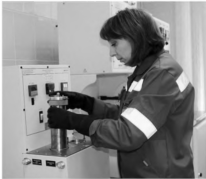
Техника не подведет, и люди – тоже

«Топкинский цемент» готовится запустить производство тампонажного цемента ПЦТ I-G-CC-1, применяемого для крепления нефтегазовых скважин. В июле цех «Лаборатория и ОТК» предприятия получил оборудование для испытаний этой продукции.