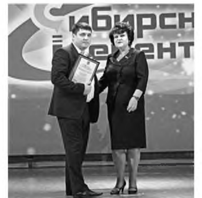
Праздник «Строители истории города Топки» состоялся в культурно-досуговом центре «Цементник»

Наименование (название) газеты – «Сибирский цемент». Учредитель и издатель: Акционерное общество «Холдинговая Компания «Сибирский цемент» (АО «ХК «Сибцем»)). Газета зарегистрирована в Федеральной службе по надзору в сфере связи, информационных технологий и массовых коммуникаций РФ Св. о регистрации ПИ № ФС 77 – 51684 от 08.11.2012. Адрес редакции и издателя: 650010, РФ, Кемеровская область, г. Кемерово, ул. Карболитовская, строение 1/4 Главный редактор: Д. В. Сафонова; т. 8 (384-2) 49-63-00; ф. 8-923-514-37-75, gazeta@sibcem.ru Распространяется бесплатно на территории Кемеровской, Новосибирской областей, Красноярского края и Республики Бурятия.