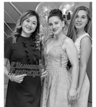
Праздничная атмосфера царит и в Кемерово