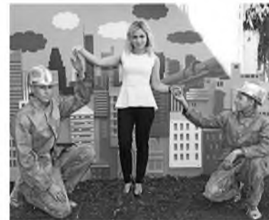
В Топках гостей торжества встречали аниматоры, загримированные под статуи