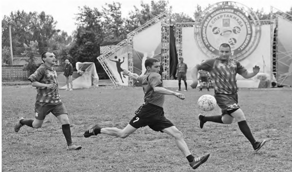
Спортивные поединки цементников вновь пройдут в Иркутской области

– С нетерпением ждем спартакиады и активно к ней готовимся. Мы надеемся значительно улучшить прошлогодние показатели и занять призовые места во многих дисциплинах.