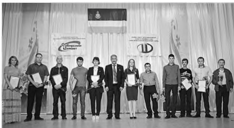
Лучших цементников Каменска чествовали в молодежном центре досуга «Сибирь»