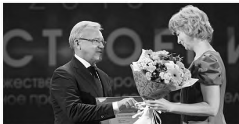
Накануне Дня строителя работников красноярских предприятий холдинга пригласили на праздник «ПРОСТРОЕНИЕ'2018»