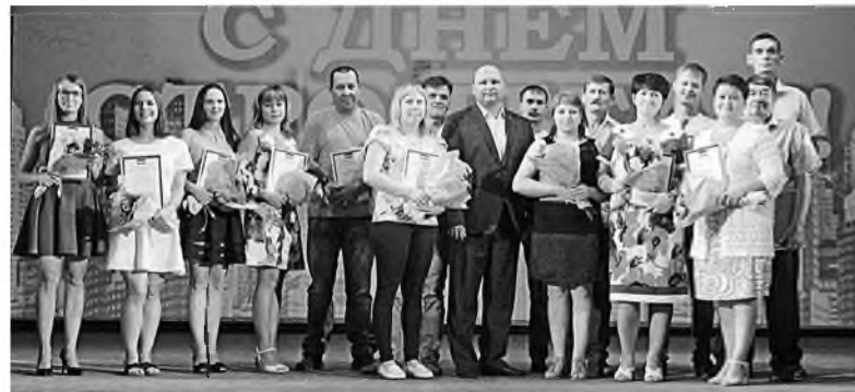
Заслуженные награды получили работники комбината «Волна»