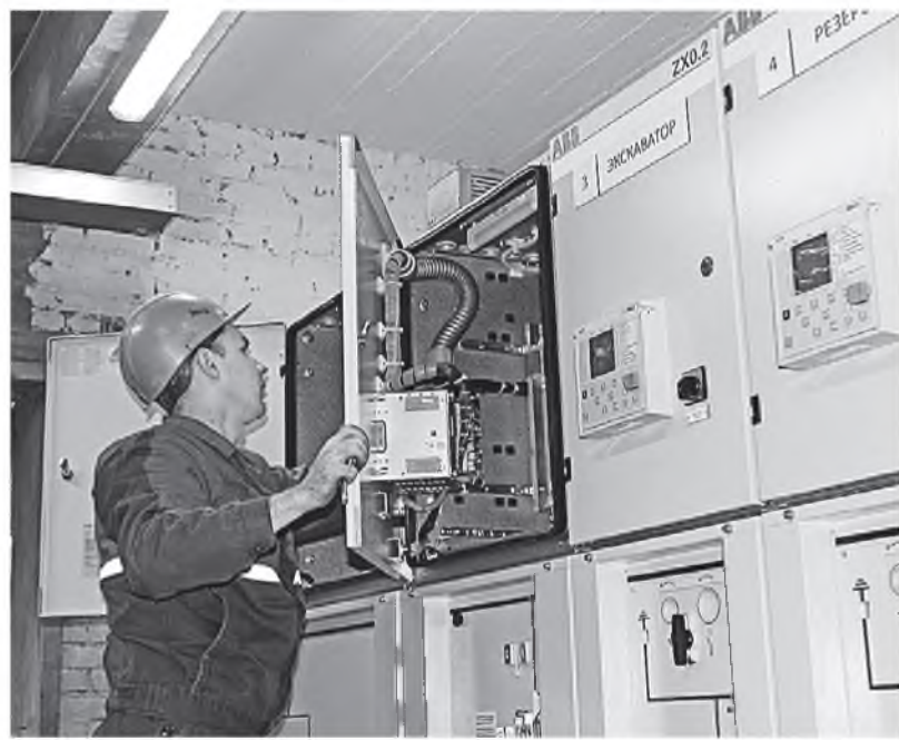
Заводчане принимали активное участие в подключении нового оборудования

На Топкинском цементном заводе завершен инвестиционный проект по замене высоковольтных ячеек в отделении «Гидрофол» цеха «Сырьевой».