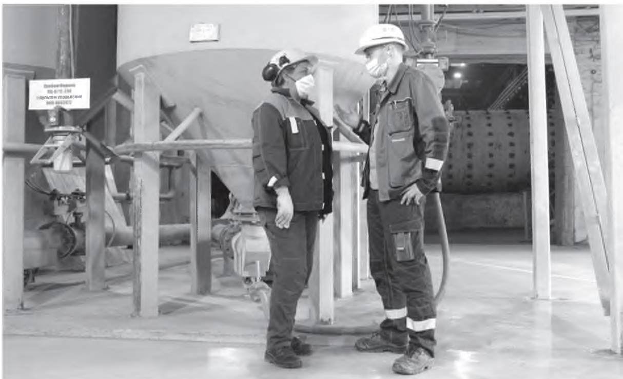
Специалистам АО «Ангарскцемент» удалось сократить удельный расход воздуха на 30%

Новые возможности открылись в 2020 году в рамках реализации инвестиционного проекта модернизации системы замкнутого цикла помола на цементных мельницах № 1 и 2 с установкой сепаратора: старые насосы демонтировали и установили ПКН-1.5Н/1-6 (г. Тольятти) с нижней разгрузкой. В результате после введения новых агрегатов в опытную эксплуатацию в конце мая 2020-го расход воздуха снизился до 20-25 нм 3 на одну тонну цемента.