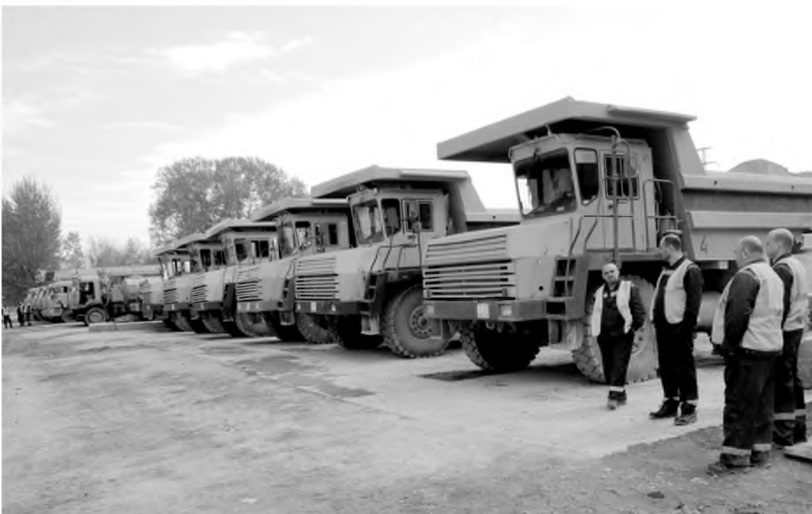
«Красноярский цемент» в ожидании конкурсной комиссии