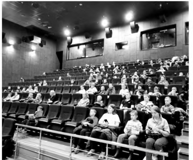
Дети работников «Ангарскцемента» посетили кинотеатр