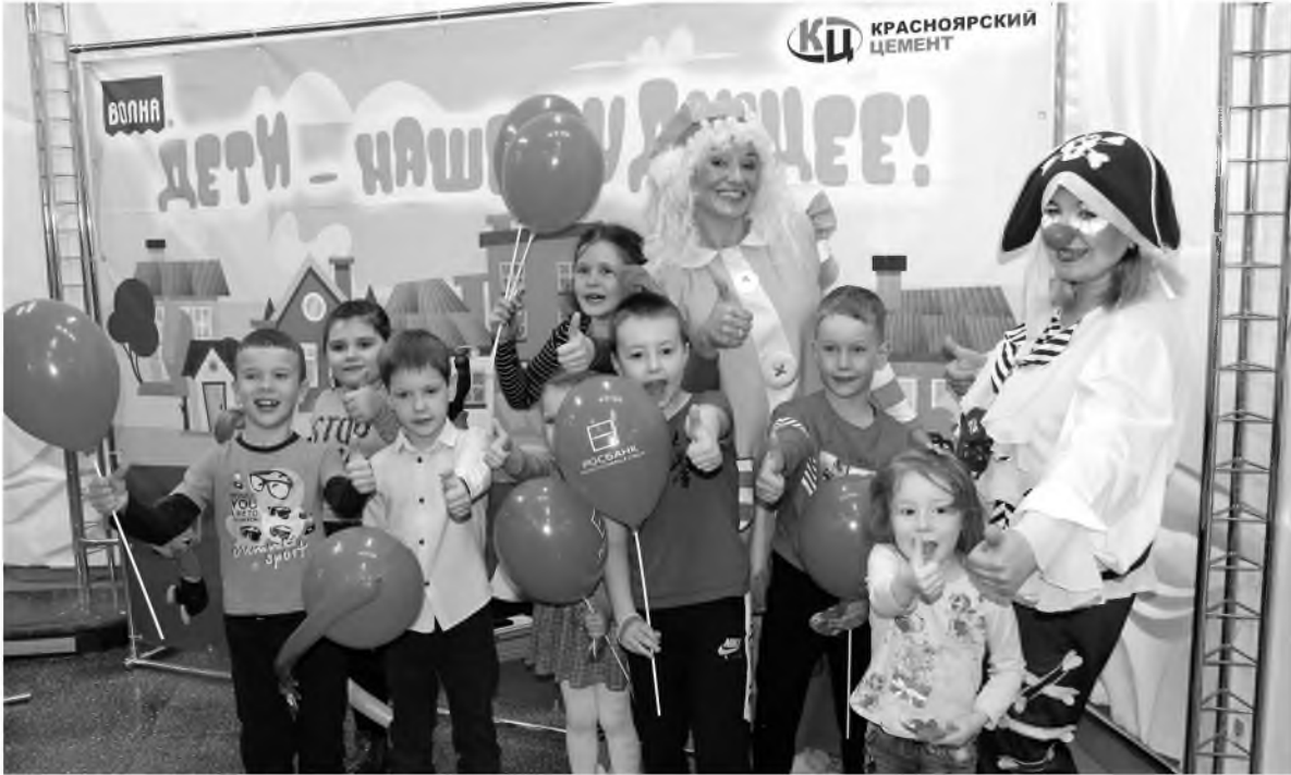
Винновиков торжества в Красноярске развлекали аниматоры – клоун, фокусник и другие

В связи с напряженной эпидситуацией в регионах торжества в честь Дня защиты детей прошли не на всех предприятиях «Сибирского цемента». Праздник состоялся на кузбасской, красноярской и ангарской площадках.