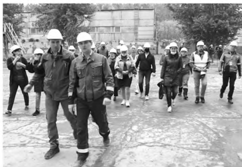
Потребители продукции оценили результаты модернизации Красноярского цемзавода