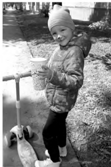
Маленьких топкинцев на праздничной программе побаловали аквагримом