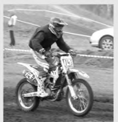
«Сибцем» поддержал традиционный мотокросс в Топках

Всего на старт вышли 102 гонщика в возрасте от 6 лет до 71 года. Награды соревнований разыграли владельцы мотоциклов объемом двигателями 50, 65, 85 и 125 кубических сантиметров. Отдельно выступили любители и ветераны. По итогам мероприятия участники, занявшие призовые места в каждом классе, получили медали, кубки, памятные подарки от организаторов и спонсоров турнира. Лидерами общего зачета стали спортсмены из Томска. Им удалось обойти команды городов Новокузнецк и Кемерово – эти сборные заняли второе и третье места соответственно. «Соревнования по мотокроссу в Топках объединяют опытных