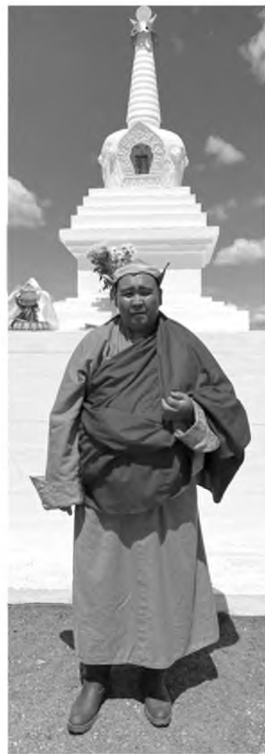
20 июня состоялось торжественное открытие Ступы просветления

«Бурятия – многонациональная республика, где сообщество представителей разных народов со своими культурными и религиозными традициями. Каждый этнос имеет неотъемлемое право сохранять свою самобытность и чтить веру предков. Несколько лет назад холдинговая компания «Сибирский цемент» оказывала поддержку православной церкви в поселке Каменск, в этом году выделила материальную помощь дацану. Многие из буддийских религиозных сооружений создаются из цемента, логично, что именно наше предприятие – как единственный произво-