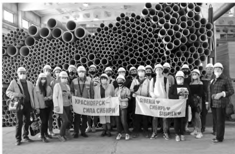
Красноярцам интересно не только производство, но и жизнь коллектива «Волны»

На комбинате «Волна» состоялась экскурсия в рамках проекта «Красноярск – город профи», реализуемого при грантовой поддержке Агентства по туризму Красноярского края.