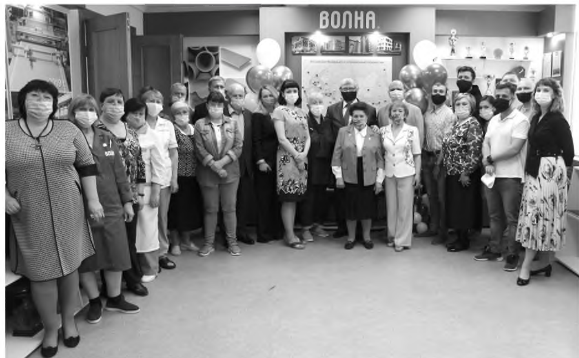
Этот снимок наверняка пополнит фотоколлекцию музея

Участник совета молодежи ООО «Комбинат «Волна», секретарь Со-