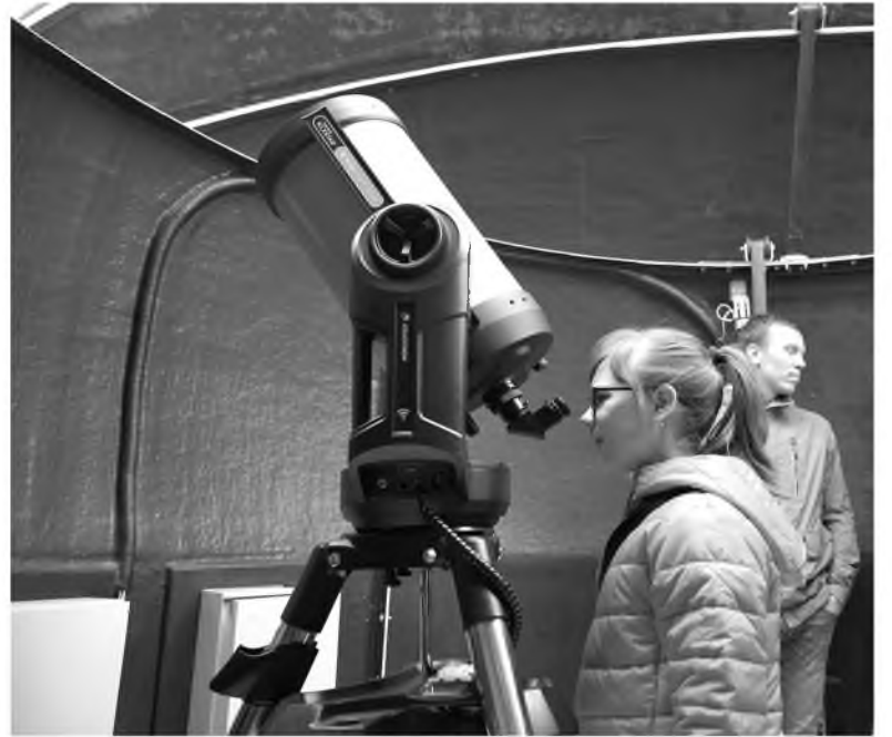
Юные кемеровчане побывали в планетарии КемГУ