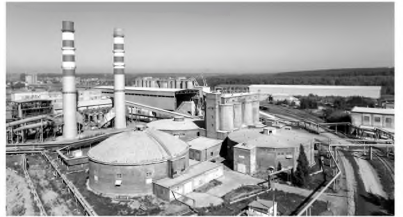
Капремонт позволит эксплуатировать трубы еще 10-15 лет

Третий этап программы в 2020 году включал техническое обследование ствола дымовой трубы вращающихся печей №8 и №9 и разработку проектной документации на капитальный ремонт. В 2021-м представители подрядной организации выполнили ремонт оголовка железобетонного ствола дымовой трубы (на отметке от +76,5 м до +80 м) с сохранением основных проектных размеров ремонтируемого участка ствола, заменой защитного колпака и элементов молниезащиты, а также антикоррозионную окраску металлоконструкций, светофорных пло-