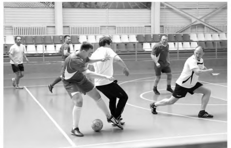
В Топках завершилось первенство по футболу

Победителем спартакиады стала команда комбината «Волна» – единственный участник, представленный во всех пяти дисциплинах. По результатам состязаний в копилку предприятия оказалось две золотых и две серебряных медали. Волновцам не было равных в мини-футболе и настольном теннисе, также им удалось завоевать второе место в стритболе