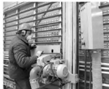
Станок DPME 21–41 позволяет выполнять высококачественный распил

Расширилась линейка кровельных материалов «Волнаколор»: теперь комбинат – помимо привычных оранжевых, шоколадных, зеленых, синих и красно-коричневых – производит и темно-серые, или «сизые», волнистые листы.