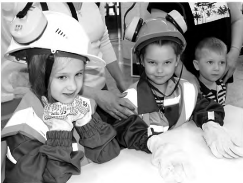
Детям сотрудников красноярской площадки холдинга выдали «трудовые книжки»